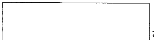
Схема границы балансовой принадлежности

_____ ; е) границей эксплуатационной ответственности объектов централизованной